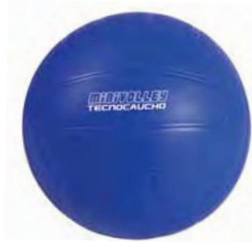
700 174 Mini-Volleyball Tecnocaucho®.