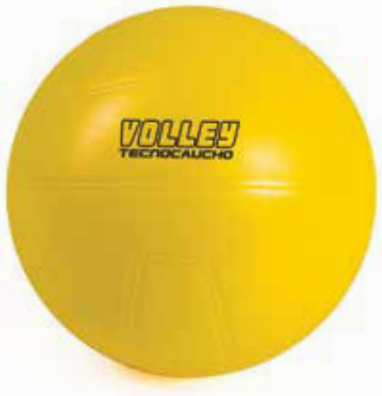
700 166 Volleyball Tecnocaucho®.