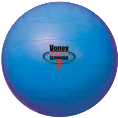
700353 Volley soft TPE laminado 2 capas. Ø 210 mm. 270 gr.