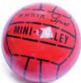
700 234 Balón voley PVC. Ø 190 mm. Volleyball PVC. Ø 190 mm.

Sonorous cellular rubber volley ball. Ø 210 mm. 270 gr.