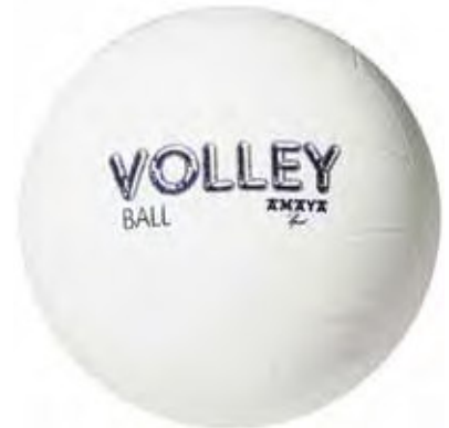
700 170 Balón voleibol termoplástico. Fabricado en una única pieza. Peso 260 gr. Ø 210 mm. Muy resistente y adecuado para patio de colegio.

Volleyball Soft TPE. Weight: 260 gr. Ø 210 mm.