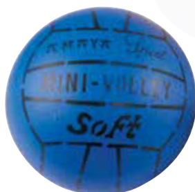
443 500 Balón voley foam soft. Ø 190 mm. Volleyball foam soft. Ø 190 mm.