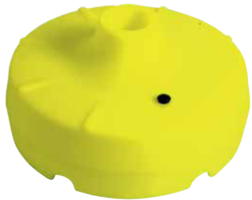
439 300 Gran base universal Ø 42 cm., alto 15 cm. Big universal base Ø 42 cm. height: 15 cm.