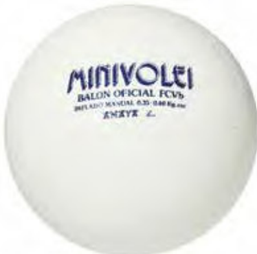
700 171 Balón minivoleibol termoplástico. Fabricado en TPE en una única pieza. Peso: 230 gr. Ø 190 mm. Muy resistente y adecuado para patio de colegio.

Volleyball thermoplastic. Made in one piece. Weight: 260 gr. Ø 210 mm. Very resistant and suitable for school yard.