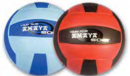
443 505 Balón voley foam soft Ø 200 mm. 280 gr. Volleyball foam soft Ø 220 mm. 280 gr.