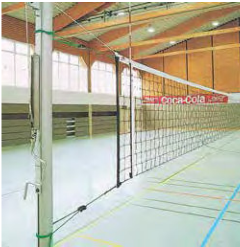
690 003 RED DE VOLEY OFICIAL. Medidas: 610 x 76 cm. OFICIAL VOLLEY NET. Meassure: 610 x 76 cm.