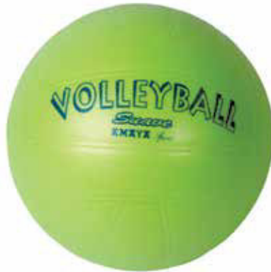
700 167 Balón voleibol soft TPE.