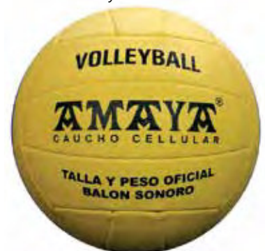
466 100 Pelota sonora de caucho celular volleyball. Ø 210 mm. 270 gr.

Mini-volleyball soft TPE. Weight: 230 gr. Ø 190 mm.