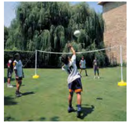
439 400 Set de voley y tenis, ancho 4 m. Alturas: 1m. para tenis, 2 m. para voley. Set volley and tennis, lenght 4 m. Height: 1 m. for tennis, 2 m. for volley.