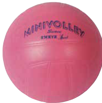
700 172 Balón mini-voleibol soft TPE. Peso: 230 gr. Ø 190 mm.

Mini-volleyball THERMOPLASTIC. Made in one piece. Weight: 230 gr. Ø 190 mm. Very resistant and suitable for school yard.