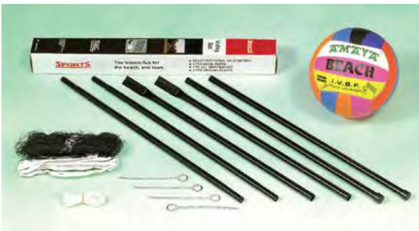
610 109 Red voley con postes metálicos. Balón voley playa cuero sintético: 3 capas Peso: 280 - 290 gr. Diámetro: 204 mm. Postes : Fabricados en acero. Longitud: 155 cm Red: Fabricada en poliestireno. Longitud: 6m x 55cm A partir de 6 años. Volley net with metalic posts. Beach Volley ball in synthetic leather: 3 layers. Weigth: 280 - 290 g. Diameter: 204 mm. Posts: Made of steel. Length: 155 cm. Net. made of poly- tiene. Length: 6 m x 55 cm. From 6 years old.